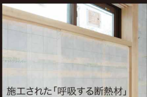
施工された「呼吸する断熱材」

呼吸する断熱材「セルロースファイバー」：見えない部分で壁体内結露は発生してしまいます。セルロースファイバーは湿気を吸ったり吐いたりして、自然に室内の空気をゆっくりとコントロールしてくれます。壁体内部に発生した結露を吐き出すことにより、カビや腐食を未然に防ぎ、家の骨格となる構造体をやさしく守り続けます。