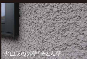
火山灰の外壁「そとん壁」

呼吸する外壁「火山灰そとん壁」：100%自然素材でありながら、独自のメカニズムにより、防水性と透湿性を両立。